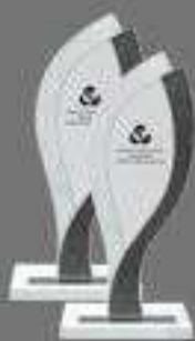
2 x Oro Premios Obrar