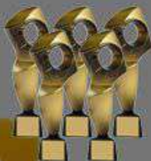
5 x Oro El ojo de Iberoamérica