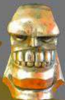
Oro Mejor escuela, El diente