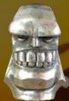
Plata Mejor escuela, El diente