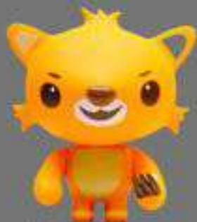
Escuela del año Oro y Grand Prix Cannes y future lions 2023