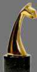
Oro La Luna