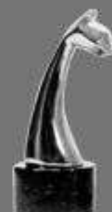
Plata La Luna