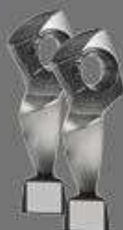
2 x Plata El ojo de Iberoamérica