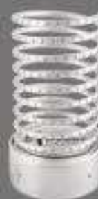
Webby People's Voice