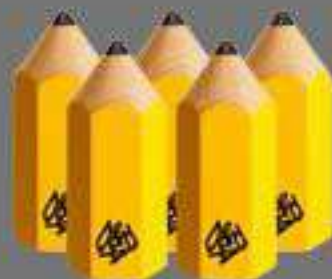
5 x Pencils D&AD