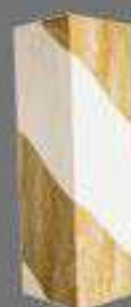
Oro Premios ADG Laus